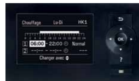
Nouvelle régulation Vitotronic – affichage clair des temps de commutation