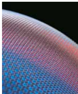
Brûleur au gaz MatriX