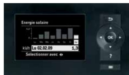
L'affichage graphique de la nouvelle régulation permet p. ex. d'afficher le rendement solaire

La régulation Vitotronic possède un guidage par menu auto-explicatif. En cas de doute, il suffit d'appuyer sur la touche d'aide pour connaître les étapes à suivre. L'interface utilisateur graphique sert également à l'affichage des courbes de chauffe et du rendement solaire. Le module de régulation pour la commande de l'installation solaire est déjà intégré. Une interface facilement accessible est disponible pour raccorder la sonde de température des capteurs solaires. Le câble de cinq mètres permet de monter le module de commande détachable de la régulation Vitotronic sur un mur dans une position accessible.