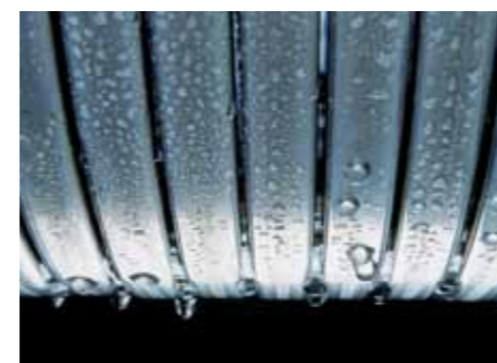
Surface d'échange Inox-Radial